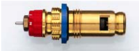
013 G 7482 seit 2001 Bezug nur über Heizkörperhersteller