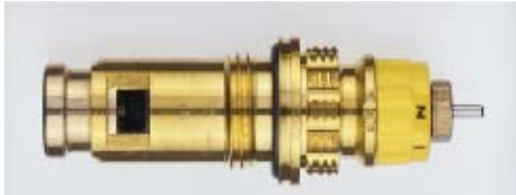
013 G 7381 / 1997 -