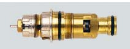
013 G 0270 / 1991 – 1997

Rote Voreinstellkrone, Montage mit 21mm Ringschlüssel Einschraubgewinde M22*1,0 Abstand der O-Ringe 43 mm