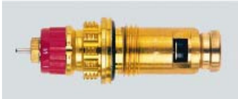
013 G 7380 / 1997 -