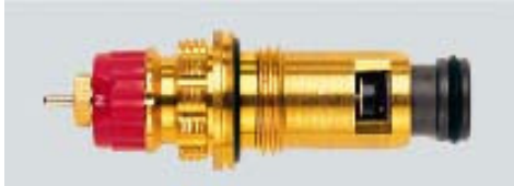
013 G 7370 / 1997 -