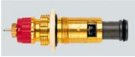
013 G 7360 / 1997 -