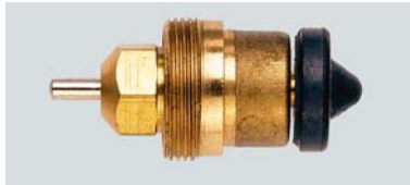
13 L 0219 / 1981 – 1986

Montage durch 3/4" Überwurfmutter, RAVL Fühleraufnahme