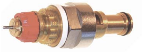
013 G 7315 / 013 G 7315