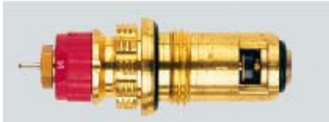
013 G 7390 / 1997 -