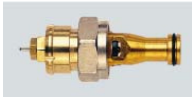
013 L 0215 / 1980 – 1989

Ersatz für 013L0215 ab 06.2006 Rote Voreinstellkrone / Codierung NJ Mit Reduzierstück 3/4" x 1/2" RA Fühleraufnahme