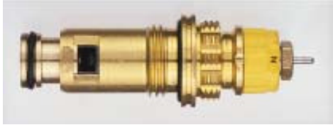
013 G 7371 / 1997 -