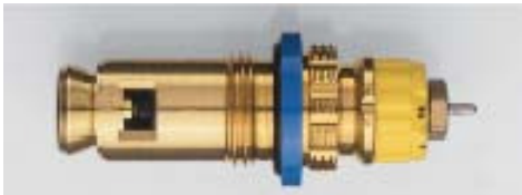
013 G 7483 seit 2001 Bezug nur über Heizkörperhersteller