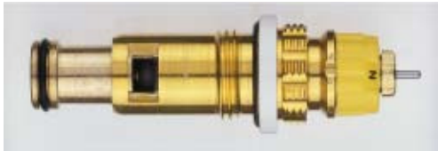
013 G 7361 / 1997 -