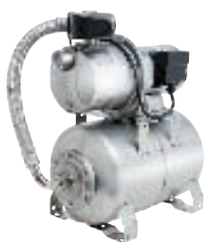
Sonderbau JEM 80/120/150 VA-Kessel und Motorgehäuse aus Edelstahl

Hauswasserwerk: Vollautomatische Anlage, komplett mit Manometer, Druckschalter, Membrandruckbehälter 24 Liter, elektrischen und hydraulischen Verbindungsteilen, Anschlußkabel und Stecker. Hoher Wirkungsgrad, daher erhöhtes Ansaugverhalten.